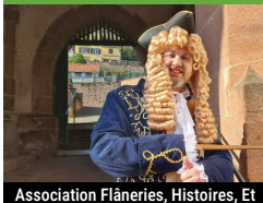
Association Flâneries, Histoires, Et