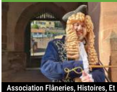
Association Flâneries, Histoires, Et