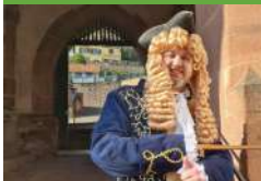
Association Flâneries, Histoires, Et