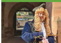
Association Flâneries, Histoires, Et