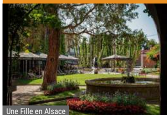
Une Fille en Alsace

1b rue du Général Gouraud 67270 Hochfelden ☎ +33 3 88 02 22 44 villa@brasserie-meteor.fr 243002985