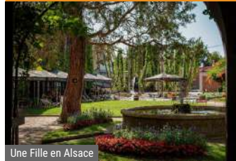
Une Fille en Alsace

1b rue du Général Gouraud 67270 Hochfelden ☎ +33 3 88 02 22 44 villa@brasserie-meteor.fr 243002985